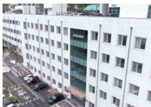
❾ 국제관 별관